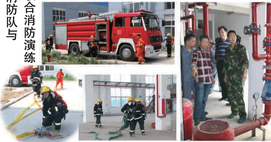
(文/唐根免 图/刘学来 宋杰)

5月19日，贾汪工业园区天工路消防中队与涂料厂在新厂区举行联合消防演练。随着新厂区的建成，在未投入生产之际举行首次消防演练，旨在熟悉厂区环境，了解安全设施布置。此次消防演练也奏响了即将开展的安全月活动的序曲。