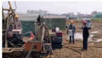
检查二勘院盱眙工地