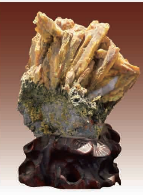
名称：雌黄、辰砂矿物集合 尺寸：12×20×10cm 陈列位置：金水路基地办公楼四楼走廊

雌黄是典型的低温热液矿物，主要成分是三硫化二砷。大多数的雌黄和雄黄一起在低温热液矿床和硫质火山喷气孔产生，所以雌黄是雄黄的共生矿物，有“矿物鸳鸯”的说法。雌黄包含有矿物和矿物两种形态。精矿为粉末状或粉末集合体；中药矿石呈块状或粒状集合体，呈不规则块状，作为中药，可用作杀虫、解毒、消肿等。