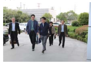
驻省国土资源厅纪检组到队进行调研

专门设立综合经营办公室，单独设立审计科，管理机构进一步完善。加强内部控制建设，成立内部控制建设领导小组、调整风险评估领导小组，出台内部审计制度，完善应收款清欠、国有资产、经营、合同、合作经营等财务管理制度，完成内部管理制度系统梳理工作，汇编成册并发送至中层以上干部。完成清产核资、公务用车统计、办公用品清理整改等工作，配合完成省财政厅的部门决算检查工作。顺利完成省纪检组对涂料厂的督查工作。顺利完成基桩公司经营增工作，并借机对以往工程项目重新进行了梳理、清理、决算和催收。及时适应并做好“三证合一”工商登记改革等新变化，自觉配合税务、工商、社保等部门的监管，依法经营、照章纳税。完善和增强财务信息系统功能，提高财务工作规范化程度。中层干部推行“日志式”管理，促使机关干部自觉转变作风、提高工作效率，不断提高管理水平。