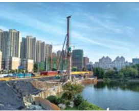
徐州地铁2号线九龙湖站嵌岩桩工程

2017年8月，随着市场的进一步拓展，在队技改资金支持下，基桩公司再次购置旋挖钻机一台，与公司已有SWS2512多功能钻机形成互补，提升公司在承接超大基坑支护工程及钻孔嵌岩桩工程方面话语权。