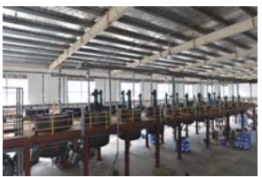
涂料厂新厂区生产车间

为满足产品研发及配套需要和解决职工生产生活的实际难题，进一步提升企业形象，进一步做大做强，做优“大光”品牌，根据省局统一部署安排，2017年9月正式启动涂料厂新厂区第二期建设项目——科技楼的基本建设工作。预计到2018年完成基建和装修工作，投入使用。