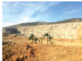
深圳市5号区域绿道龙岗区布吉段危险边坡治理工程

在做好本地区找矿和服务的同时，近年来，我队积极探索省外、境外找矿渠道，从贵州、青海等地论证了数十个勘查项目，少数的项目仍在洽谈中。